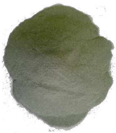
Рис. 2. Материал до измельчения