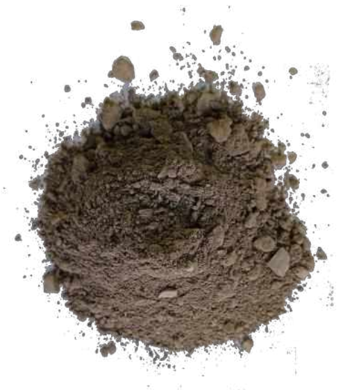
Рис. 3. Продукт измельчения