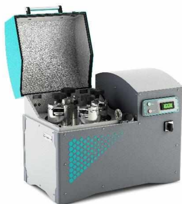
Рис. 1. Мельница планетарная МПП 1-4